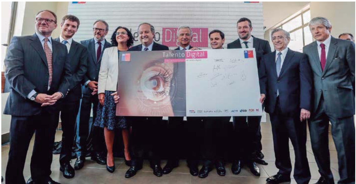
Lanzamiento de Talento Digital para Chile, Ministerio de Hacienda, enero de 2019.

Talento Digital para Chile es la única iniciativa país que desarrolla habilidades clave, acorde a las necesidades de las personas y empresas de la nueva sociedad digital. Su objetivo es acelerar la transición de Chile a la economía digital expandiendo las oportunidades de cada persona y empresa para que alcancen su máximo potencial.