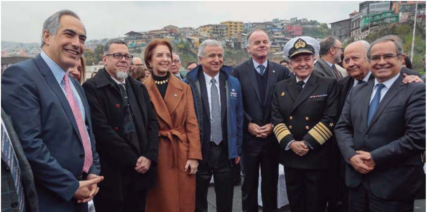
Anuncio de Interoperabilidad entre SICEX, SILGOPORT (Sistema Logístico y Portuario de Valparaíso), Directemar y el Servicio Nacional de Aduanas, Puerto de Valparaíso, agosto 2018.

Esta integración amplía la posibilidad de uso de la Declaración Única de Salida (DUS) embarcada, lo que acorta el ciclo exportador, permitiendo una solicitud anticipada de la legalización de declaración aduanera y, en consecuencia, de la devolución del IVA.