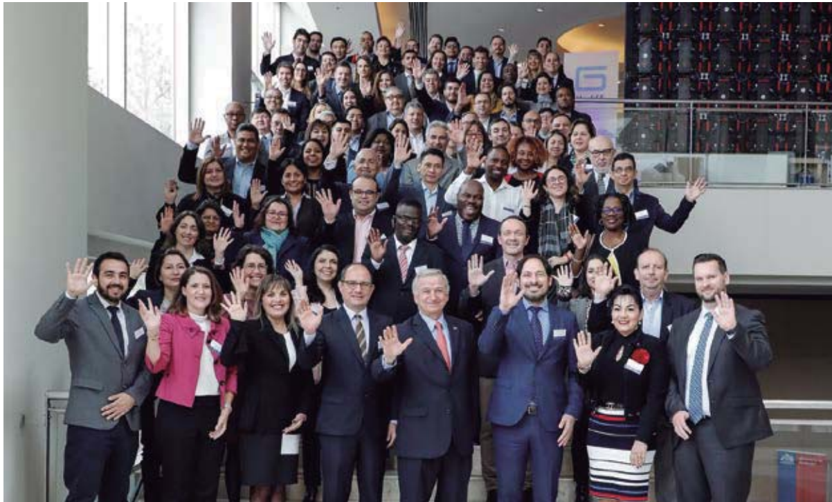
Reunión de la Red Interamericana de Ventanillas Únicas, Santiago, agosto de 2019.