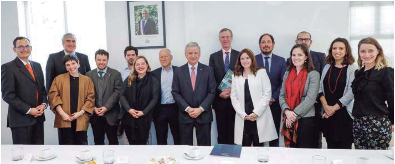
Reunión con John Newbiggin, creador del concepto Economía Creativa, Ministerio de Hacienda, julio de 2019.

El principal objetivo que ha planteado este grupo de trabajo, es abordar aspectos transversales que busquen desarrollar la economía creativa y la exportación de servicios en esta área. El grupo de trabajo también busca liderar actividades de masificación e internacionalización, así como apoyar, y acompañar a los actuales exportadores y potenciales exportadores transfiriendo conocimientos y herramientas de fomento actualmente disponibles.