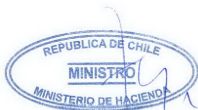
IGNACIO BRIONES ROJAS MINISTRO DE HACIENDA

“POR ORDEN DEL PRESIDENTE DE LA REPÚBLICA”