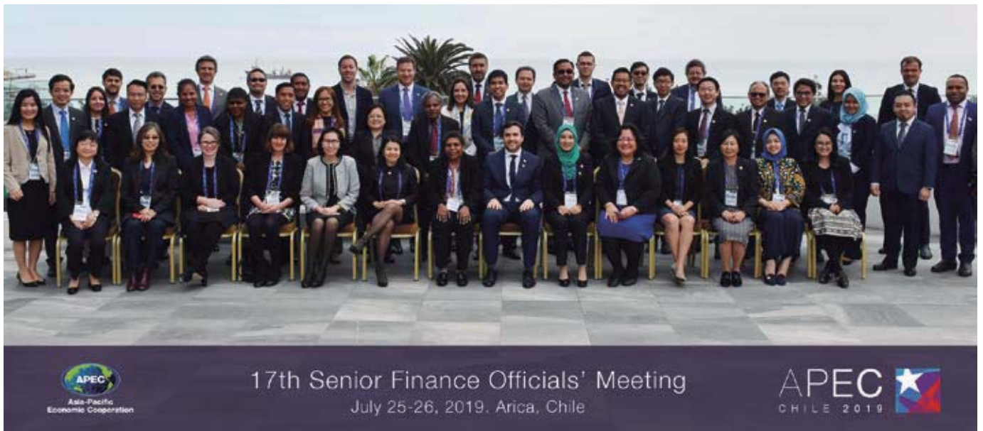
Reunión de Seniors de Ministerios de Hacienda, Arica, julio de 2019.

representan un 40% de la población mundial, el 60% del Producto Interno Bruto (PIB) global y el 50% del intercambio comercial total.