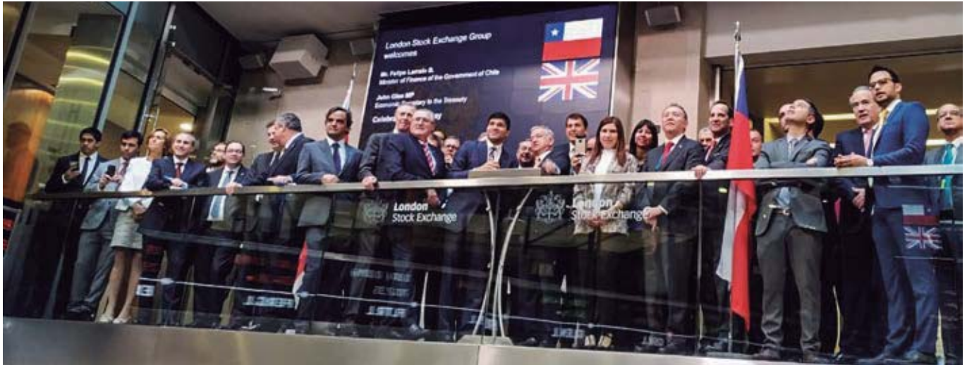
ChileDay, Londres, septiembre de 2019.

ChileDay es una iniciativa público-privada, liderada por el Ministerio de Hacienda de Chile y la organización privada sin fines de lucro, InBest, que tiene como objetivo continuar los esfuerzos del Gobierno para posicionar a Chile como el principal centro financiero en la región.