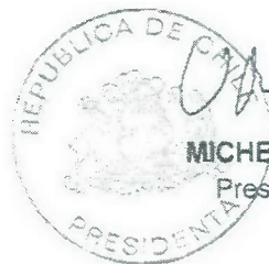
Michelle Bachelet MICHELLE BACHELET JERIA Presidenta de la República