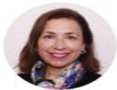
TRINIDAD INOSTROZA Presidenta